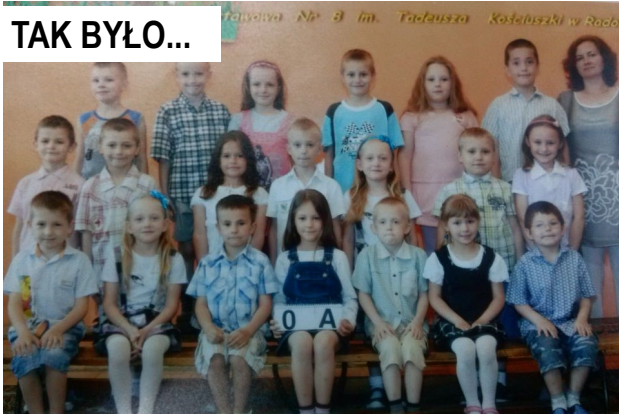
Tak wyglądaliśmy w „zerówce”