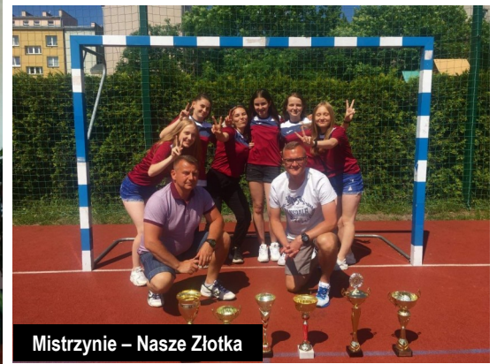
Mistrzyni – Nasze Złotka

2015 - I miejsce w halowej piłce nożnej dziewcząt 2016 - II miejsce w unihokeju dziewcząt 2017 - II miejsce w unihokeju powiatowym